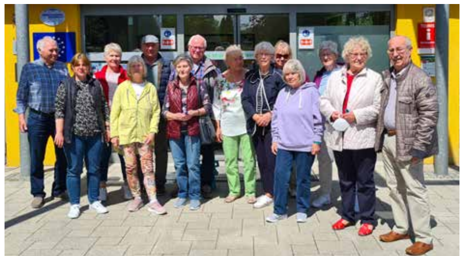
Fröhliche Gruppe vor der Moortherme

JETZT ANMELDEN! Ganzjähriger Nordic-Walking-Kurs im Knoop's Park. Wann: immer Dienstags von 16.00-17.00 Uhr Wo: Treffpunkt Parkplatz Kränholm, Bremen-St.Magnus Kosten: EUR 30,-/Halbjahr für Mitglieder