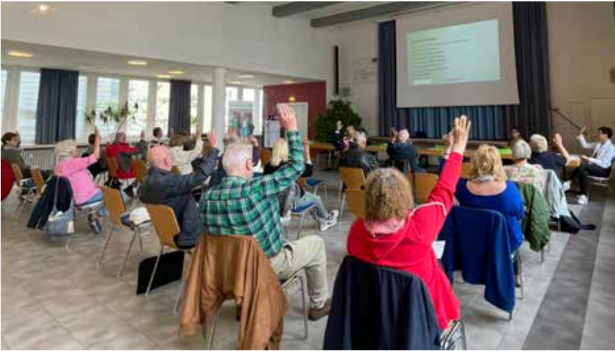
Die Mitglieder bei der Abstimmung