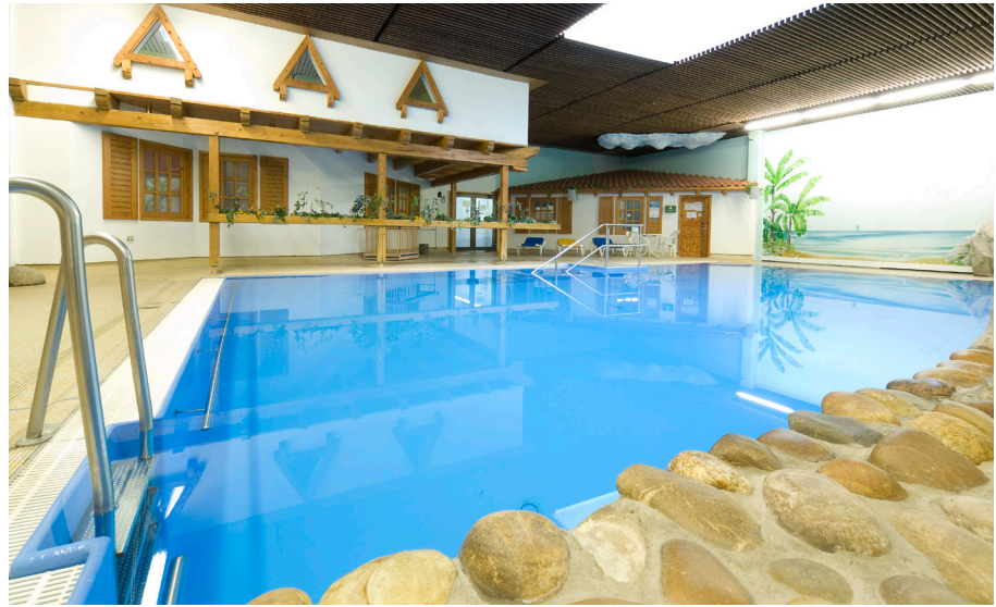
Bewegungsbad in der Sportwelt

Was möchten Sie unseren Rheuma-Liga-Mitgliedern gerne einmal sagen? Erst einmal ein Dankeschön, dass Sie unse-