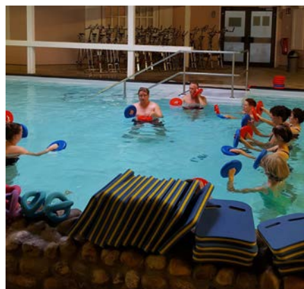
Die Übungsleiter*innen in Aktion

dem Thema der Bearbeitung von Gruppenprozessen, -rollen und -krisen. Dabei kam u.a. die Dynamik in der Entwicklung von Gruppen nach dem Tuckman Phasenmodell, das Persönlichkeitsmodell der Transaktionsanalyse nach Eric Bene und wie ein Rapport durch Anpassung des Ausdrucksverhaltens an den Anderen nach dem Prinzip Pacing und Leading aufgebaut werden kann zur Sprache.