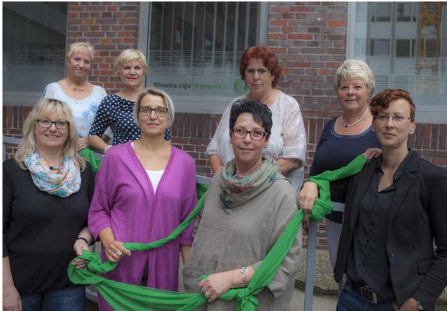
Das Geschäftsstellen-Team wünscht ein erfolgreiches 2019!